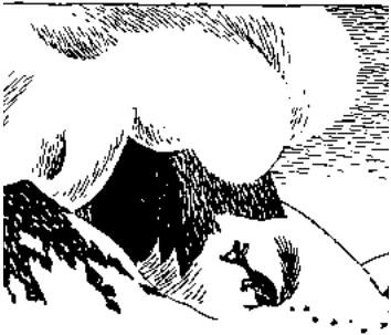
Ekorren (med den vackra svansen)