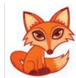
toppkonsument – räv