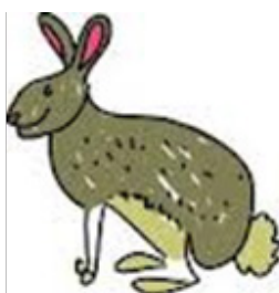
konsument – hare